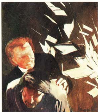
Csernus Tibor: Sartre: Piszkos kezek, 1979 olaj, papír, 24,5x18 cm

Csernus vérbeli festő, ám rajzait és képeit egyaránt meghatározták az irodalmi motivációk és inspirációk. Elég, ha korai festményére,