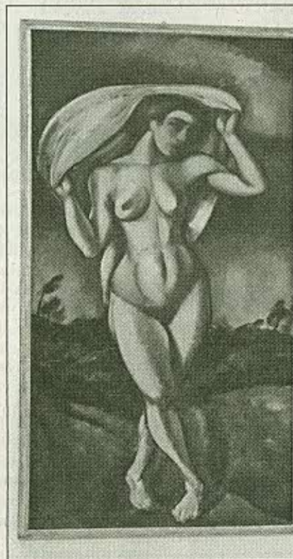
A tárlaton Márffy Nyolcak-korszakának képei is láthatók

Márffy Ödön négyéves párizsi tanulóidő után mutatkozott be képeivel a budapesti közönségnek. Gulácsy Lajossal 1907 márciusában közösen tartott kiállítása már komoly elismerést hozott számára, felfigyelt rá Rippl-Rónai József és Kernstok Károly is. Így lett alapító tagja az első, modern festőket tömörítő hazai szervezetnek, a MIÉNK-nek; és kapcsolódott Kernstok Károly köréhez, akivel később a Nyolcakat alapította. 1908-tól rendszeresen lejárt Kernstok nyergesújfalui birtokára festeni, ahol együtt kísérleteztek a francia fauve-ok – Matisse, Derain, Braque – nyomán élénk színkontrasztokkal festett kompozícióikkal. A Nyergesújfalun megforduló művészekből szerveződött az a csapat, amely később megalakította az első magyar avantgárd csoportot, a Nyolcakat: Márffy Fűrdő nők című vásznával egyike lett a legbotrányosabbaknak. Az elkövetkező években festészetét folyamatos átalakuláson ment keresztül, a szertelen ecsetkezelést felváltotta a Cézanne hatását tükröző, szigorú kompozíciós rend. 1924-ben alapító tagja, majd elnöke lett a modern magyar törekvések ernyőszerzetének, a KUT-nak. A második világháború után bekapcsolódott az Európai Iskola munkájába, ám az ötvenes években ellehetetlenült. A figyelem csak a kultúrpolitika fokozatos enyhülésével fordult megint felé: a beteg és idős Márffy 1959 decemberében hunyt el.